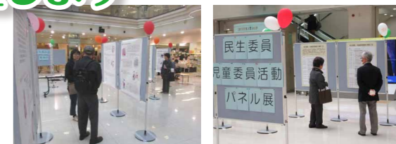
昨年行ったパネル展・相談会の様子

【日 時】平成29年5月12日(金)~16日(火) 【場 所】サンピアザ1階光の広場