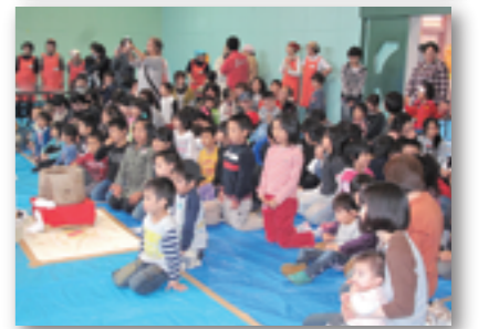
金山ふれあい餅つき大会 場所 金山児童会館