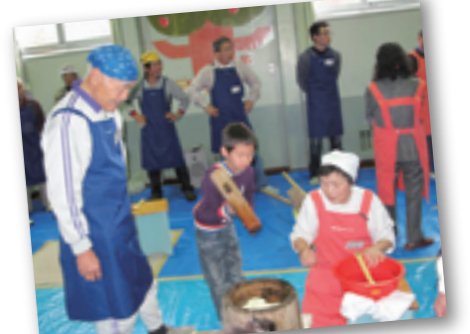
稲穂ふれあい餅つき大会 場所 稲穂児童会館