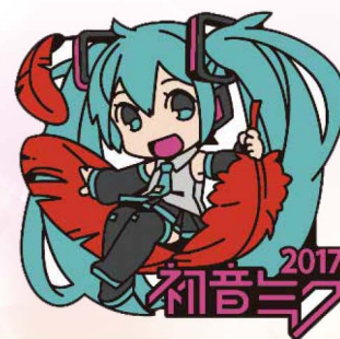
illustration by 8'108 © Crypton Future Media,INC. www.piapro.net piapro