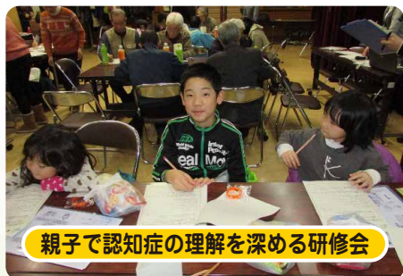
親子で認知症の理解を深める研修会