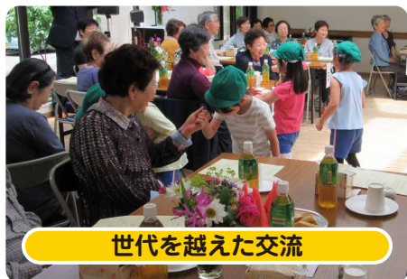
世代を越えた交流

地区社協・福まちではこんな活動をしています ※本誌折り込みの福まちかわら版もご覧ください