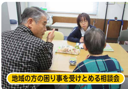
地域の方の困り事を受けとめる相談会