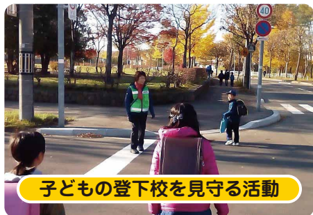
子どもの登下校を見守る活動