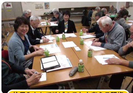
住民みんなで地域のことを考える研修