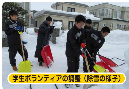
学生ボランティアの調整 (除雪の様子)