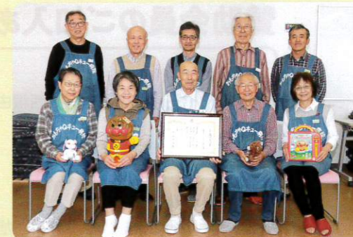
おもちゃQキュー病院のスタッフの皆さん

厚別区の誕生とともに白石区のおもちゃ病院から独立して30年。厚別区民センター2階で活動を続け、今年2月には修理件数1万件を突破しました。多くの子どもたちから感謝され、昨年は厚生労働大臣表彰も受賞しています。