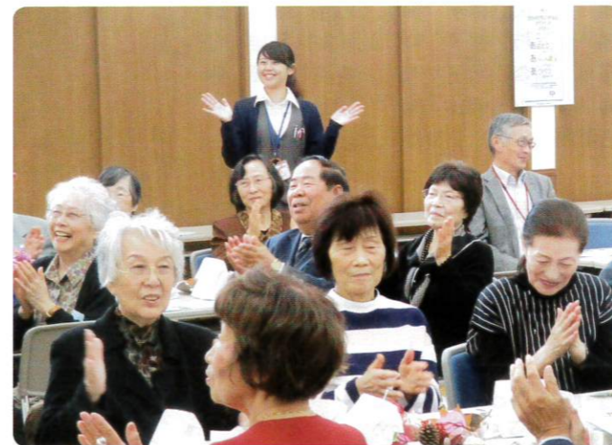
手拍子をしながら脳トレをする参加者の皆さん