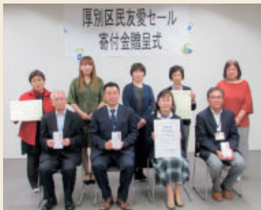
厚別区連合女性部連絡会議の皆さん