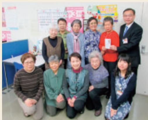
ボランティアグループつぼみの皆さん