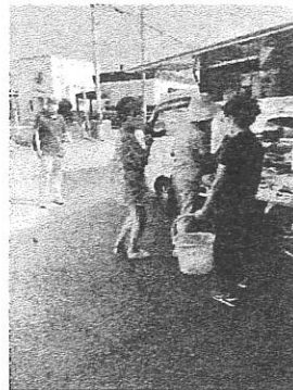
コロナ感染対策をしながら ご近所さんと会話