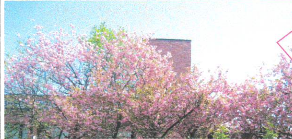
今年もきれいに咲いてね。まちづくりセンターの桜 (撮影 2019)

1月～3月、福住地区福祉のまち推進センターでは、町内会・民生児童委員を通じて「携帯用緊急時対応カード」を高齢者(80歳以上の方と75歳以上お一人暮らしの方)へお配りさせていただきました。まだ受け取られていない方は、福祉のまち推進センターへお申し出ください。(※年齢は令和2年4月1日時、取り次ぎ：福住まちづくりセンターTEL 851-6615)