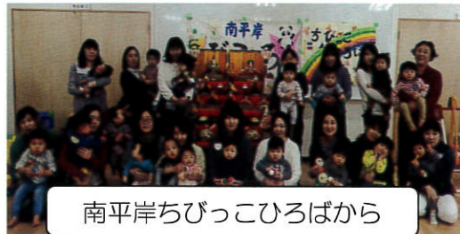
南平岸ちびっこひろばから