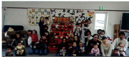
最後の平岸高台ちびっこひろばです