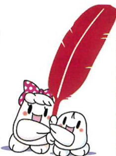
赤い羽根と シンボルキャラクター

令和2年10月2日(金) 地下鉄南平岸駅前と西友平岸店前で街頭募金運動を実施しました。 例年になく、暖かい日になり、募金活動ができました。 南平岸地区として、¥18,874 円の募金が集まりました。街頭募金にご協力いただきましてありがとうございました。