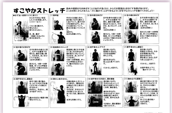
介護予防センター新琴似が作成した「すこやかストレッチ」のパンフレット

生活支援体制整備事業が目指すのは“ 社会的孤立を生まない、つながりのある地域づくり ”です。感染リスクを避けるために、あらゆる会合が中止され、今まで培ってきたつながりを継続することが難しくなっています。また、外出を控えて閉じこもってしまうことで、高齢者の心身の活力低下も心配されています。今回の戸別訪問で、住み慣れた地域で、誰もが健康的に末永く生活していくために、生活支援コーディネーターには何ができるのかをあらためて考えるきっかけとなりました。