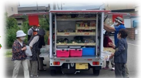
買い物支援で生まれた支えあい