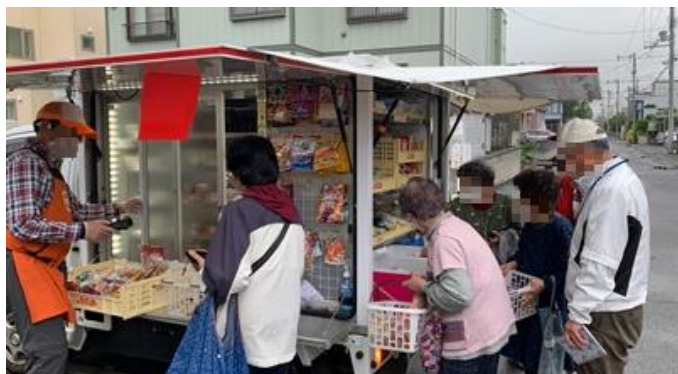
会話も弾み、楽しくお買い物