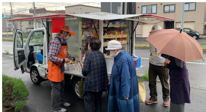
家の近くに来てくれ雨の日も安心