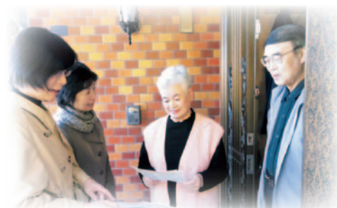
(写真は平成25年度福まち活動写真コンクール入賞作品)