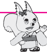
マスコットキャラクター ほっ・とちゃん

高齢や障がい、産前産後などで日常生活にお困りの方(利用会員)へ、援助活動を行いたい方(協力会員)を派遣調整し、各種在宅福祉サービスを提供します。