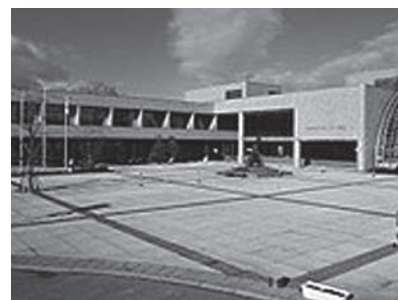
札幌市保養センター駒岡

区社協・事業所等連絡先（中央区） ○中央区社協 281-6113 ○中央ヘルパーセンター・あんしん 24 中央 272-8480 ○総合支援センターえがお 231-3294 ○訪問看護ステーションあんしん 208-3511 ○中央相談センター 272-3294 ○中央区第1地域包括支援センター 209-2939 ○介護予防センター大通 271-1294 ○中央調査センター 280-7801 ○ナイトケアセンター 208-3800