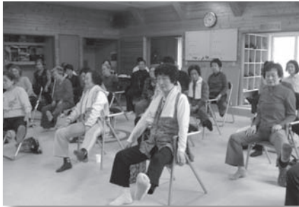
転倒予防教室の様子

介護予防センターでは、認知症予防教室、転倒予防教室、すこやか倶楽部、介護予防教室（口腔機能向上、栄養改善、うつ予防、閉じこもり予防）などを開催しています。