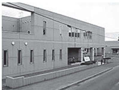
札幌市東老人福祉センター