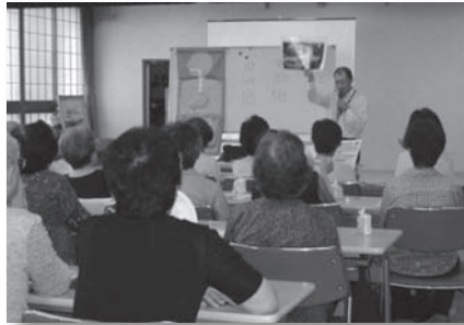
介護予防教室の様子