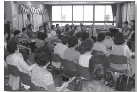
すこやか倶楽部（音楽療法）の様子

介護予防センターでは、介護や健康、福祉などの総合相談も行っています。お一人おひとりのご相談から地域での取組まで、お気軽にご相談ください。