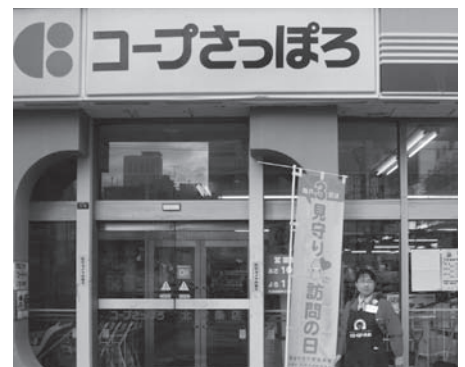
コープさっぽろ 北12条店

生活協同組合コープさっぽろ、イオン北海道株式会社、ホームック株式会社、株式会社日本旅行北海道札幌支店