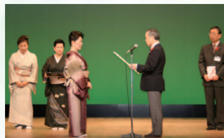
絆の会 翔扇寿啓様