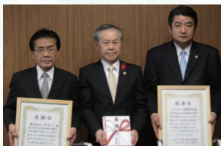
ツルハホールディングス様 ユニチャーム様