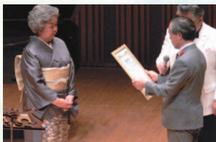
さっぽろ旭山うた祭りの会様