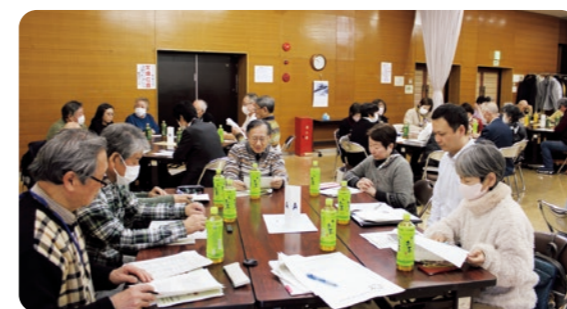
今回は、厚別中央・厚別南・厚別西・厚別東地区福まちの皆さんも、自分たちの活動の参考にするために参加されました。

グループワークの事例は、ただ資料を配るだけでなく、福まちの皆さんがそれぞれの役を演じて、よりイメージしやすくなりました。