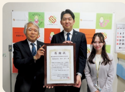
明治安田生命保険相互会社札幌支社 様