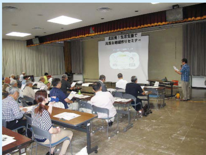
9月に開催されたセミナーの様子

北区ではこの事業をすすめていくにあたり、9月15日に「北区発！生活支援で元気な地域づくりセミナー」を開催しました。当日は地区社会福祉協議会、町内会、老人クラブ、ボランティア活動者等81名の方が参加し、