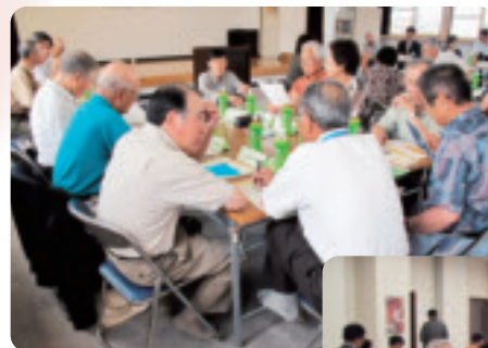
日常からの見守り活動の重要性について再認識【稲山連合町内会】

※11月17日には、曙連合町内会で開催されます。活動の経過については今後も順次報告していきます。