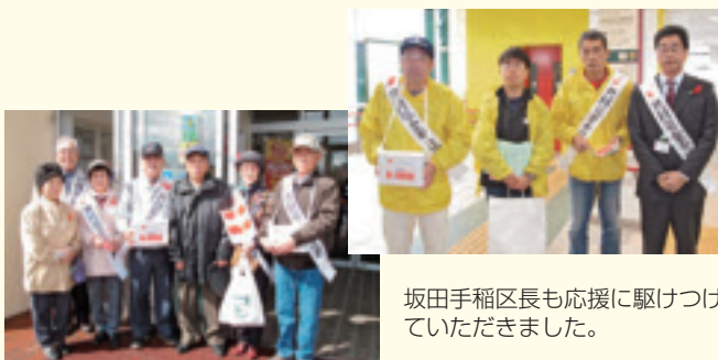
坂田手稲区長も応援に駆けつけていただきました。

募金いただきましたみなさま、また、活動者及び快く活動場所を提供いただきました店舗等のみなさまありがとうございました。