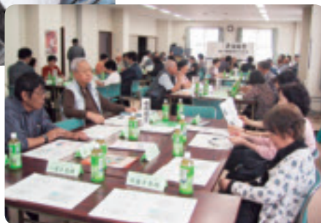
災害時の要援護者の具体的な支援方法について意見交換【山口団地連合町内会】