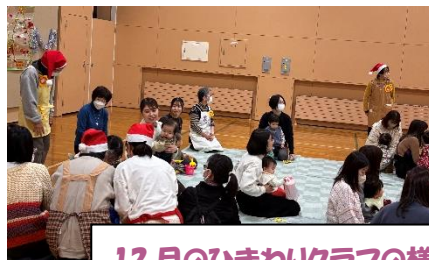
12月のひまわりクラブの様子

毎月、お誕生月の参加者の方へ メッセージカードと、手作りのリース作成 し、お歌と共にプレゼント！みなさん 毎年楽しみにされています♪