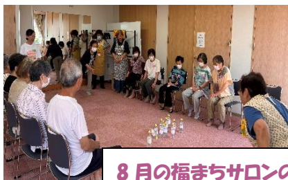
8月の福まちサロンの様子