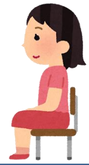
座圧測定結果のイメージ

専用の機器を使って、座った状態での圧力分布(座圧)を測定してみましょう。床ずれリスクを軽減するクッションの選び方、ポイントを学びます。