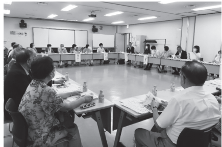
▲南区地域見守りネットワーク推進会議

札幌市では、札幌市社協が主催の「札幌市地域見守りネットワーク推進会議」を年2回、各区社協が主催の「区地域見守りネットワーク推進会議」を年1回開催しています。