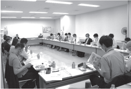
▲札幌市地域見守りネットワーク推進会議