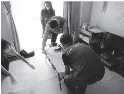
▲ボランティア活動の様子

地域の方からは、「こういうことも企業さんはしてくれるんだね」と活動を好意的に捉えているようです。