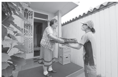
▲宅配「トドック」の様子

また、ポストに新聞や郵便物がたまっているといった場合には他の配達後に再訪問したり、状況によっては所属センターへ連絡した上で消防・警察・行政等へ連絡しています。