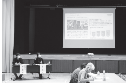
▲東区地域見守りネットワーク推進会議