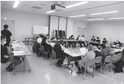
▲清田区地域見守りネットワーク推進会議