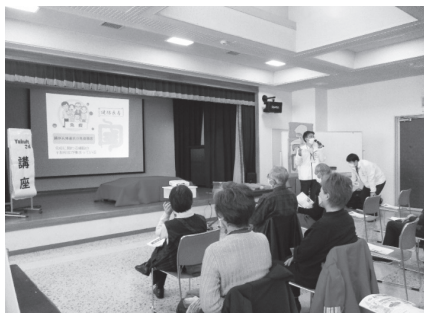
▲健康セミナーの様子