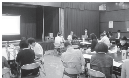
▲厚別区 もみじ台地区