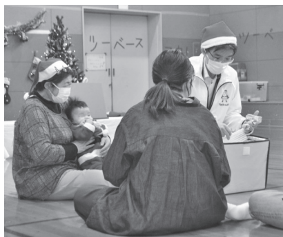
▲子育てサロンの様子