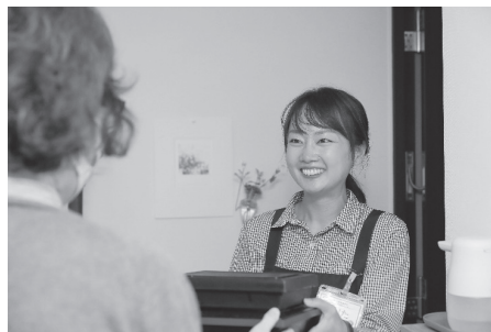
▲夕食宅配「クルリン」の様子