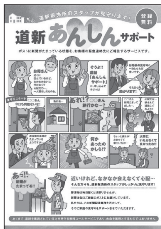
▲道新あんしんサポート